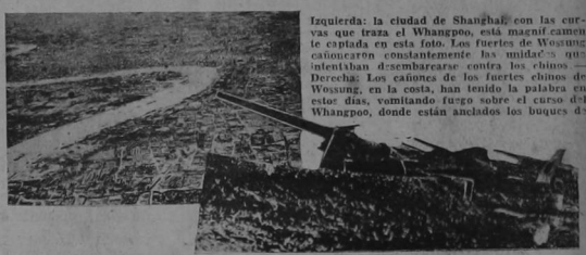
Izquierda: la ciudad de Shanghai, con las curvas que traza el Whangpoo, está magníficamente captada en esta foto. Los fuertes de Wusung cañoneros constantemente las unidades que intentan desembarcar contra los chinos. Derecha: Los cañones de los fuertes chinos de Wusung, en la costa, han tenido la palabra en estos días, volviendo sobre el curso del Whangpoo, donde están anclados los buques de guerra nipones. Durante muchos días las baterías que se ven en la foto, y muchas más, han funcionado repetidamente contra la escuadra del sol naciente.

Director: JOSE MARIA PINAUD. PAGINA SIETE. AÑO XVIII. Número 5662. San José, Costa Rica, A. C. Martes 7 de Septiembre de 1937